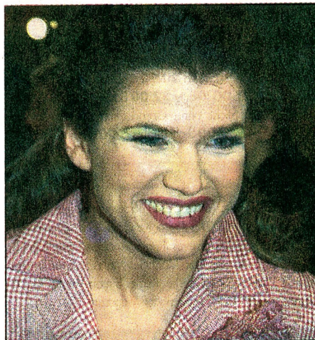
SEHR WITZIG: Über Anke Engelke lachen die Deutschen am liebsten.

Comedy-Star Anke Engelke sorgt offenbar für die meiste Erheiterung in deutschen Wohnzimmern: 29 Prozent der Deutschen lachen am liebsten über die 37-Jährige, wie eine Umfrage der Hamburger Zeitschrift „Fernsehwoche“ ergab, die die F&S Internet Infotainment GmbH durchgeführt hat. Auf dem zweiten Platz landete Michael „Bully“ Herbig , über den sich 25 Prozent der 512 Befragten am besten amüsieren können.